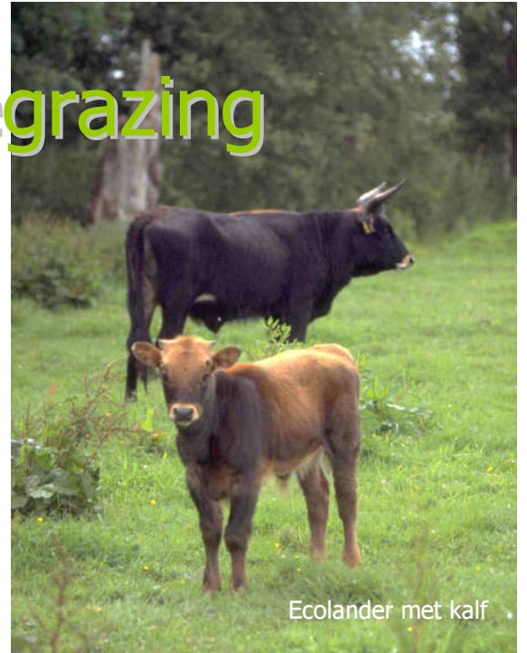
Ecolander met kalf